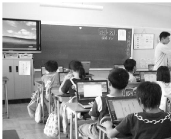
図1. 2010年 公立小学校における 大型液晶テレビとノートパソコンでの学習風景

このような取組の中で形成されてきた、教職員のICT活用意識については「ICTの活用が教科指導中心であるため、教科学習や教科と領域を合わせた学習が充実しているが特別支援教育分野での活用については未知数である」 3) とされて、記述式アンケートの回答では、特別支援における活用を要望