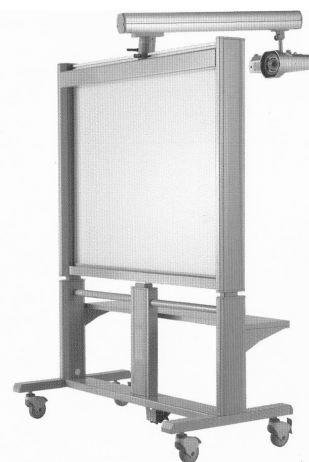
図5. 「透過型大型電子情報ボード」

調査内容 通級指導教室に情報端末機器として透過型大型電子ボード(図5)を設置し、個々の児童への指導において、①ICT機器の活用の有効性、②WEBコンテンツの2点の聞き取り調査を通級指導教室担当者に行った。また、支援を受けた児童の学習効果を確認するために、通級指導教室担当者及び母学級担任への聞き取り調査、保護者への記述式アンケートを実施した。保護者へのアンケートは「電子黒板やインターネットの教材を使うことでどのような変化が、子どもにありましたか」「インターネットの教材はご家庭でも、環境があれば使うことができます。利用された場合の感想をお願いします。」とした。