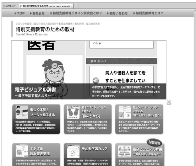
図4. 「特別支援教育のためのWEB教材」 特別支援教育デザイン研究会、 http://www.e-kokoro.ne.jp/ss/1/ (子どもゆめ基金教材開発・普及助成活動)

取組としては、インターネット上における WEB コンテンツに注目し、その配信システム構築の目標を定め(図 3)、方向性として「本プロジェクトにおいては、八幡市に構築されたネットワークシステムや情報端末を利用し、学級担任や特別支援学級の担任等が特別支援教育を充実させるための WEB におけるポータルサイトでの専門性、信頼性のあるコンテンツの配信システムの構築を目指す」と示し、配信システム上で活用すべきコンテンツについては