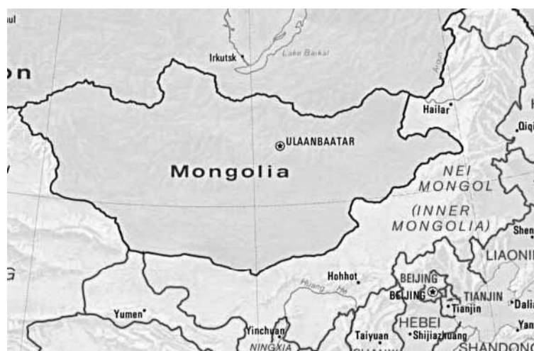
図3 モンゴル国と内モンゴル自治区の地図 1)

内モンゴル民族高等専科学校でのインタビューにおいて分かったことは、教員養成を行っている専門学校では、教員の作成したパソコン教材を液晶プロジェクタで映すこと等、授業において、ICTの活用が日常的に行われていることであった。