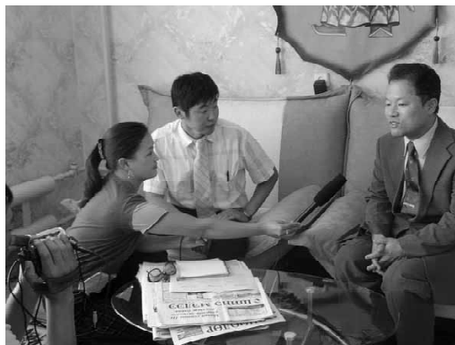
図2 地方の県でテレビ局の取材を受ける筆者

この JICA プロジェクトへの参加が契機となって行ったのが、以下に述べる調査と、国際協力活動である。