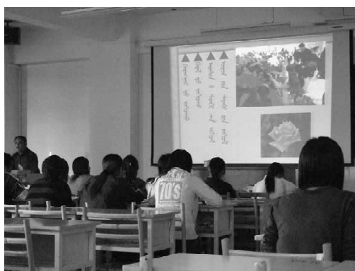
図4 モンゴルの縦文字で学ぶ学生たち

内モンゴル民族高等専科学校でのインタビューにおいて分かったことは、教員養成を行っている専門学校では、教員の作成したパソコン教材を液晶プロジェクタで映すこと等、授業において、ICTの活用が日常的に行われていることであった。