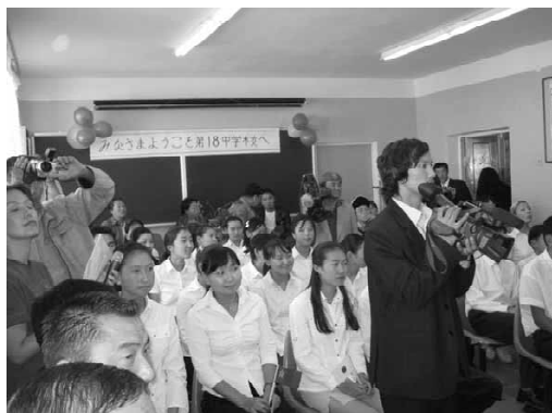
図1 蒙日交流学習の様子

2005年には、電気の確保や研修会でのマナー（具体的には、携帯電話）が課題として挙げられたが、現在は教員研修の成果でもあるがそれらは改善の方向に向かっている。